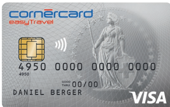
Cornercard easyTravel Visa

Sì, desidero ordinare una Cornercard easyTravel: il pratico denaro per il viaggio in CHF, EUR o USD.