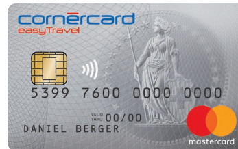
Cornercard easyTravel Mastercard®